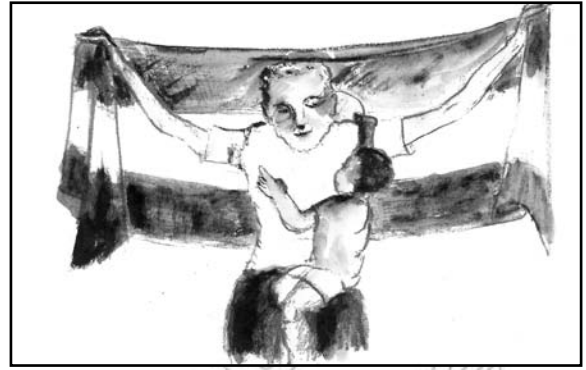
Fakkii 5.5 Alaabaan Biyyoolessaa Itoophiyaa ibsituu Birmaddummaa keenyaa ti.