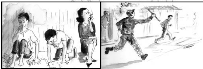
Fakkii 5.1. Gochawwan diigoo fi miidhoo