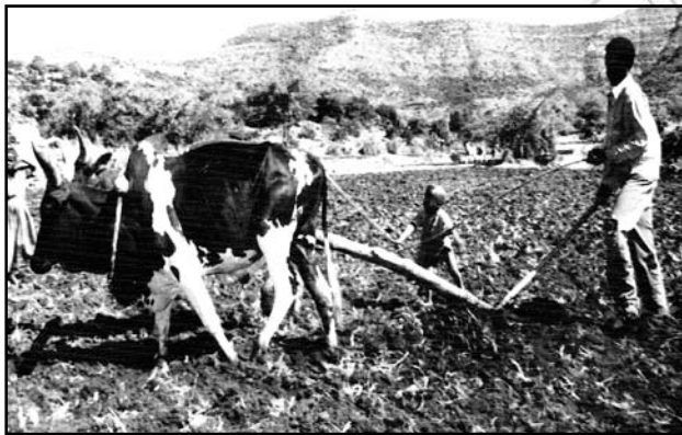
Fakkii 5.3 Jabaatanii hojjechuun hiyyummaa dhabamsiisuu