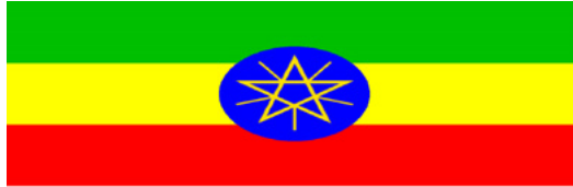
ስእሊ 5.5 ሰንደቅ ዕላማ ኢትዮጵያ መግለጺ ሉኣላውነትና እያ