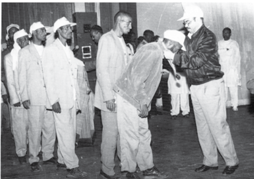
5.2. ነጠፍካ ምስራሕ ክትምስገን ይገብር