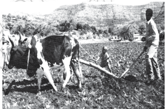
5.3. ጠንኪርካ ብምስራሕ ድኽነት ምውጋድ ይካኣል