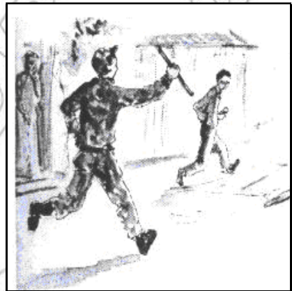
ስእሊ 5.1 መዕነውትን ጎዳኣትን ተግባራት ምቕምም ሃገሩ ካብዝፎቱ ኩሉ ዜጋ ትፅቢት ይግበር