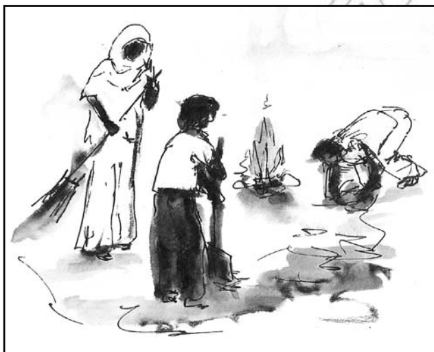
Fakkii 6.1 Sadaasa 12, guyyaa duula qulqullina aadaawaa yommuu ummati waliin kosii gubu.