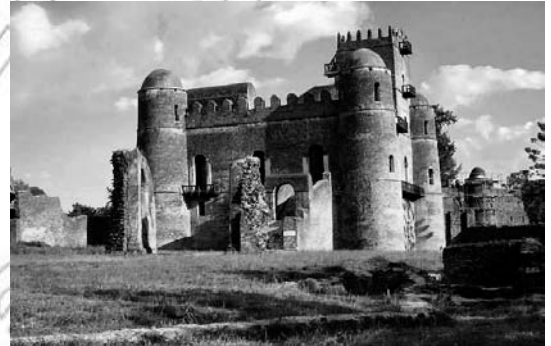
Fakkii 6.2 Qabeenyaa umamaa fi dabareewwan seenaaf kunuunsi taasifamuu qaba

Qabeenya uumamaa fi dabareewwan seenaa jechuun uumamaan kan argamanii fi hawaasni jiruuf jireenya isaa keessatti kan uume mallattoo enyummaa isaati.