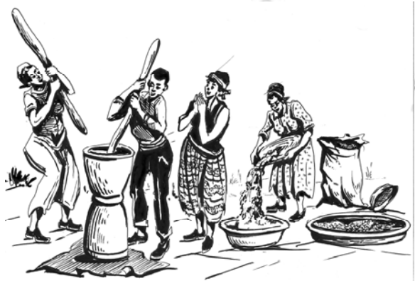
ሥዕል 7.2 ሥራን በጋራ መሥራት ወጤታማ ይደርጋል