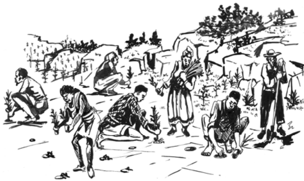
ምዕል 7.1 የተራቀቀ መሬትን ደን የማልበስ ተግባር