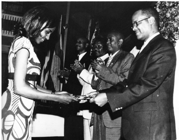
ምዕል 8.4 በላቀ የሥራ ወጤት ተሸላሚ ጀግኖች

በሥዕሉ ላይ ያሉትን ሰዎች ተመልከቱ እና ሌሎችን በተለያየ ሙያ ሽልማት ካገኙት መካከል የምታውቋቸውን ሰዎች ስም እየጠራችሁ ግለጹ።