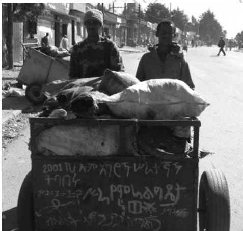
ምዕል 8.2 ራስን የመቻል ተገባር