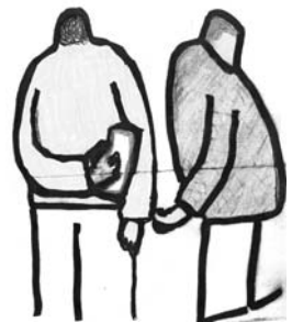
ምዕል 8. 3. ገዋ አጸያፊ ተግባር ሲሆን፣ ኮንትራባንዲስቶችም ከሕግ አያመልጡም