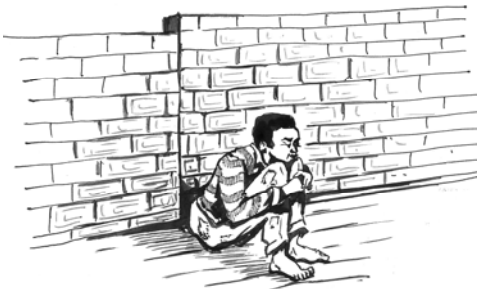
ምዕል 8.1 የምጽዋት ጥገኛ