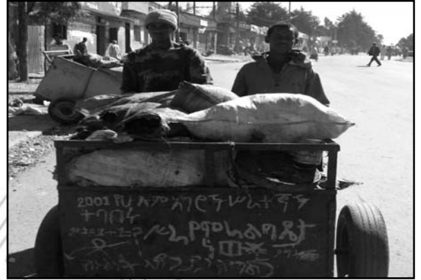
Fakkii 8.2 Gochaa of danda'uu