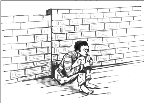
Fakkii 8: 1 Gochaa hirkattummaa