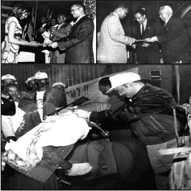
Fakkii 8.4 Bu'aa hojii olaanaaf kabaja kennuu