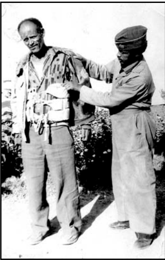
Fakkii 8.3 Matta'aan gochaa jibbiisaa yoommuu ta'u daldaltooinni kontiroobaandiis seera jalaa hin ba'an.

Manaa jireenyaa fi mana barnootaatti akka dandeettii keenyaatti hojjiwwan nuti raawwachuu dandeenyu maal fa'i? Hojjiwwan kana hojjechuu dhiisuun hirkattummaan akkamitti ibsama?