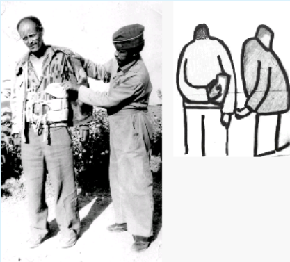
Jaantuska 8.3. Alaabo si qarsoodi ah dalka looga saaro & kala qaadashada laaluushka