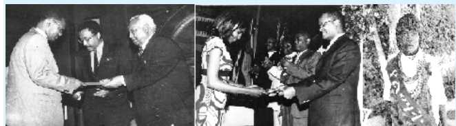
Sawirka 8.4. Dad waxtarkooda looga abaal gudayo