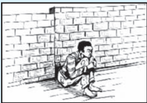
Jaantuska 8.1. dad dulsaar ku ah Dad kale.