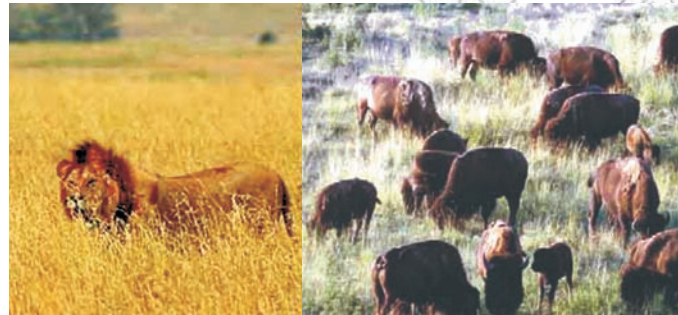
(B) Savaanaa dhugaa