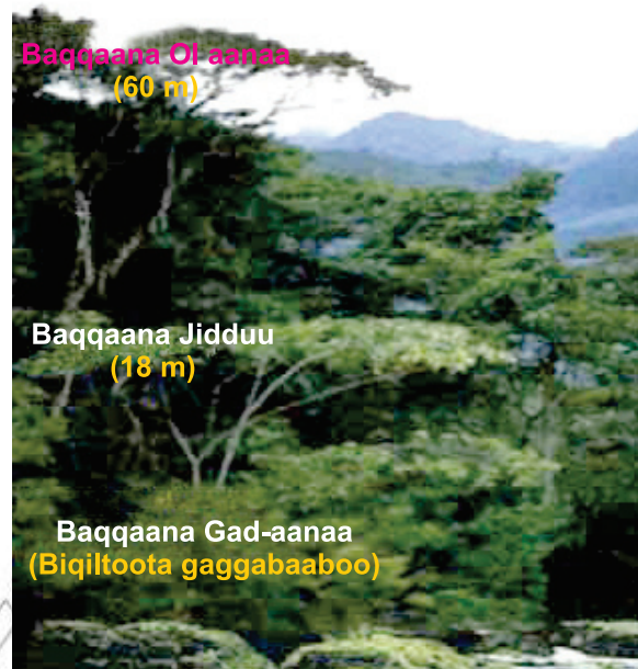
Fakkii 3.3. Baqqaanota Biqiltoota Bosona Roobaa naannoo Mudhii Lafaa

Naannoon kun waggaa guutuu rooba guddaa argata. Kun ammoo biqiltoonni akaakuu adda addaa baay'inaan akka argaman taasisee jira. Hammi rooba waggaa naannoon kun argatuu 1500 mm hanga 2500 mm ta'a. Biqiltoonni naannoo bosona mudhii lafaa baqqaana sadi qabu. Kunis, biqiloota dheerina hanga 60 m qaban, biqiloota jidduu galeeyyii dheerina hanga 18 m qabanii fi biqiloota gaggabaaboo miila jalatti biqilan fa'a.