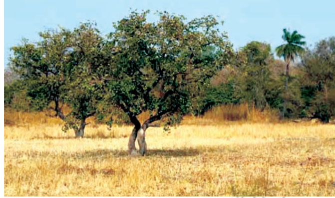
(A) Paarki Savaanaa

argamu. Naannoon savaanaa akka naannoo Bosona roobaa mudhii lafaa rooba waggaa guutuu hin argatu. Waggaa keessatti waqtii rooba argatuu fi rooba hin arganne ifatti beekaman qaba.