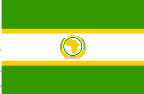
ምሥል 4.10 የአአድ ሠንደቅ ዓላማ

የአፍሪካ አንድነት ድርጅት (አአድ) የተመሠረተው እ.ኤ.አ ግንቦት 25 ቀን 1963 በአዲስ አበባ ከተማ ነው። የድርጅቱ ቻርተር የተፈረመው በ31 የአፍሪካ ነጻ መንግሥታት ነው። ከጊዜ በኋላም ነጻነታቸውን የተቀዳጁ አዳዲስ አገሮች ድርጅቱን ተቀላቅለዋል።