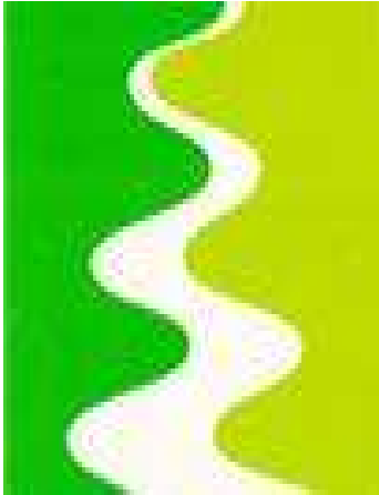
ምሥል 4.9 የናይል ተፋሰስ ሀገሮች ኅብረት አርማ

ኅብረቱ የተጀመረው በወንዙ ተጠቃሚ በሆኑ ሀገሮች መካከል በተደረገ የውይይት ሒደት ነው። ኅብረቱ በይፋ የተቋቋመው እ.አ.አ የካቲት 1999 ዓ.ም ወንዙን በጋራ በሚጠቀሙ ዘጠኝ ሀገሮች የውኃ ሀብት ሚኒስትሮች ነው። እነርሱም ግብጽ፣ ሱዳን፣ ኢትዮጵያ፣ ኡጋንዳ፣ ኬንያ፣ ታንዛኒያ፣ ቡሩንዲ፣ ሩዋንዳ፣ ኮንጎ ዲሞክራቲክ ሪፐብሊክ ናቸው። ኤርትራ አባል ብትሆንም በናይል ተፋሰስ ላይ ያላት ድርሻ በጣም አነስተኛ በመሆኑ በኅብረቱ ያላት ተሳትፎ ዝቅተኛ ነው።