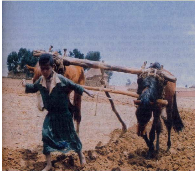
ምሥል 4.4 ሕጻናት ከከባድ የጉልበት ሥራ መጠበቅ አለባቸው።

አንዳንድ ሕጻናት በድህነት ምክንያት ያለ ዕድሜያቸው ለመሥራት ይገደዳሉ። በኢትዮጵያ እና በሌሎች የአፍሪካ ሀገሮች የገጠር ቀበሌዎች ሕጻናት ከብት በመጠበቅ፣ ሰብል በመሰብሰብ ውኃ በመቅዳት፣ የማገዶ እንጨት በመሸከም እና በሌሎች ቤተሰባዊ ሥራዎች ሲሳተፉ ማየት የተለመደ ትርኢት ነው።