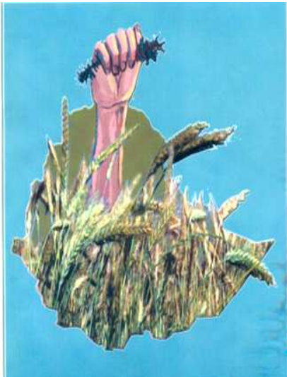
ምሥል 4.5 ሙስና የዕድገት ፀር ስለሆነ በጋራ እንታገለው

ሙስናን በቁጥጥር ስር አድርጎ መልካም አስተዳደርን ለማስፈን ህብረተሰቡን በሰፊው ማንቀሳቀስ፣ በመንግሥት አሰራር ውስጥ ግልፅነትንና ተጠያቂነትን ማስፈን ያስፈልጋል። ዴሞክራሲ በሌለበት ግልፅነትና ተጠያቂነት የመንግሥት አሰራር መሠረታዊ መርሆዎች ሆነው ተግባራዊ ሊሆኑ አይችሉም። የህዝቡን ችግሮች ለመፍታትና ፍላጎቶቹን ለማሟላት የሚያስችሉ ፖሊሲዎችን በብቃት ለመቀየስና ለመፈጸም የህዝቡን ተሳትፎ ማረጋገጥ አስፈላጊ ነው። ዴሞክራሲ በሌለበት ፋይዳ ያለው የህዝብ ተሳትፎ ሊኖር አይችልም። በመሆኑም ዴሞክራሲና መልካም አስተዳደር በጥብቅ የተሳሰሩ ጉዳዮች ናቸው።