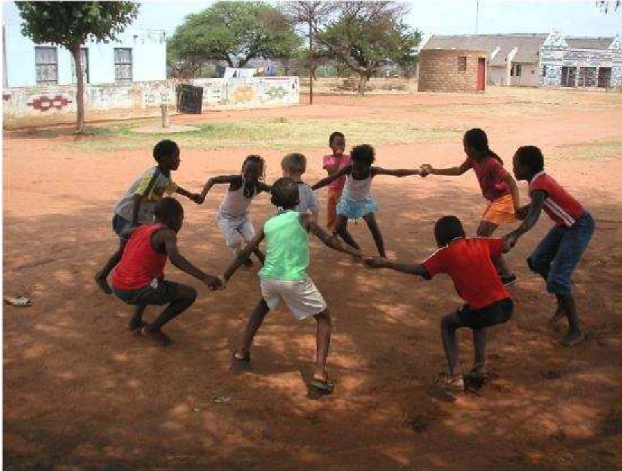
ምሥል 4.2 ሕጻናት ለእድሜያቸው ተስማሚ በሆነ ሁኔታ የመዝናናትና የመጫወት መብት አላቸው።

የሽግግር መንግሥት የተወካዮች ምክር ቤት ኅዳር 29 ቀን 1984 ዓ.ም በአደረገው ስብሰባ ተቀብሎ አጽድቋል። ይህም የኢትዮጵያ መንግሥት ለሕጻናት መብቶችና መልካም አስተዳደግ የሰጠውን ትኩረት ያረጋግጣል።