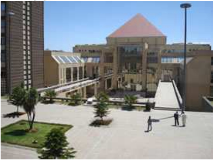
ምሥል 4.12 የአፍሪካ ኅብረት ዋና ጽሕፈት ቤት በአዲስ አበባ

የአፍሪካ ኅብረት ራዕይ የተዋሐደች፣ የበለፀገች፣ ሠላማዊ የሆነች፣ እና በራሷ ዜጎች የምትመራ ጠንካራ ዓለም አቀፋዊ ኃይል ልትሆን የምትችል አኅጉር መገንባት ነው።