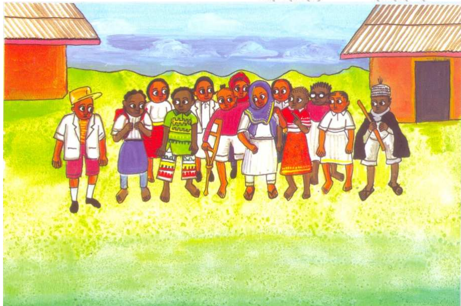
ምሥል 4.3 ሕጻናት በዘር፣ በቀለም፣ በጾታ፣ በቋንቋ፣ በሃይማኖት ወዘተ መድሎ አይደረግባቸውም

በዚህ ድንጋጌ መሠረት ሕጻን ማለት ዕድሜው ከ18 ዓመት በታች የሆነ ማንኛውም ሰው ነው። በኢትዮጵያ የሠራተኞች አዋጅ መሠረት በሥራ ለመቀጠር ዝቅተኛው ዕድሜ 14 ዓመት ነው። ዕድሜያቸው ከ14 እስከ 18 ዓመት የሆኑት “ወጣት ሠራተኛ” ተብለው ሊቀጠሩ ይችላሉ። ማንኛውም አሠሪ ከ14 ዓመት በታች የሆነን ልጅ (ሕጻን) ቀጥሮ ማሠራት አይችልም። “ወጣት ሠራተኞች” የሚባሉት በሙሉ አደገኛ የሚባሉ ሥራዎችን እንዳይሠሩ ድንጋጌው ይከለክላል። ለምሳሌ በጣም ከባድ ሥራዎችን ማሠራት በወንጀል ያስጠይቃል። ሕጻናት በኤሌክትሪክ ኃይል ማመንጫዎች አካባቢና በከርሠ ምድር ውስጥ ሥራ እንዳይሠሩ አዋጁ በጥብቅ ይከለክላል። ሕጻናት በቀን ከሰዓት ሰዓት በላይ መሥራት የለባቸውም። በተጨማሪም ከቀኑ 10 ሰዓት በኋላና በበዓላት ቀን መሥራት የለባቸውም።