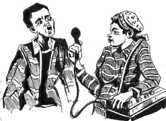
ሥዕል 10.2 ከሕገ አስታዎር አማን ጋር አጭር ቅደታ

10.1 በሕዝባዊ የልማት፣ የሰላምና የዲሞክራሲ ሥርዓት ግንባታ እንቅስቃሴ ውስጥ የዜጎች ንቁ ተሳትፎ ወሳኝነት፤