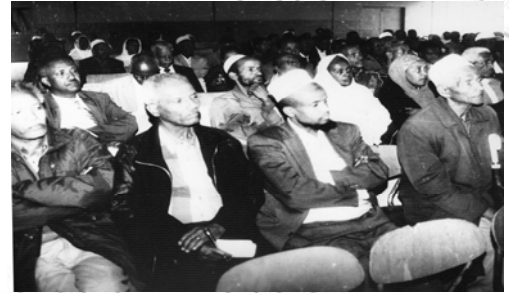
ሥዕል 10.6 የአዲስ አበባ ነዋሪዎች ፎረም አጠቃላይ ስብሰባ

✓ በሲቪክ ማህበር በመሳተፍ እንዴት መንግሥትን ማትጋትና መቆጣጠር ይቻላል?