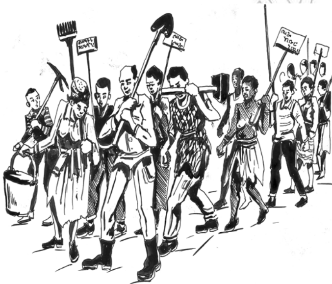
ሥዕል 10.1 ልማታችንን ሰማፋጠን በጋራ እንንቀሳቀስ