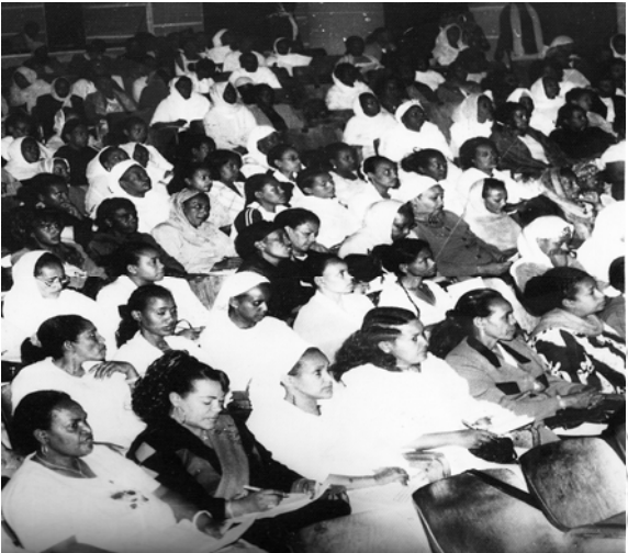
ምዕል 10.5 የሴቶች ስብሰባ

በመረጃው መሠረት ለክልሉ ትምህርት ልማት ህብረተሰቡ ያደረገውን ድጋፍ መንግሥት ከመደበው በድምሩ ብር 2675315103.37 ከሚሆነው ገንዘብ ጋር በማነፃፀር ልዩነቱን ግለጹ። ህብረተሰቡ በመረጃው የቀረበውን ድጋፍ ለትምህርት ልማት ለማሰባሰብ የቻለው እንዴት ባለ አደረጃጀት ተሰባስቦ ይመስላችኋል?