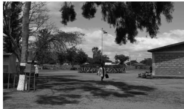
ምዕል 10.4 የትምህርት ቤት አሠራር ገልጻል፤ ተጠያቂነት ያለው ለሆነ ደገባል