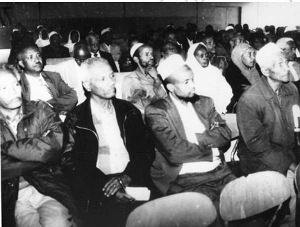
Fakkii 10.6 Walgahii waliigala fooramii jiraattota Magaala Finfinnee

Gurmaa'ina kutaalee hawaasaa adda addaa kanaan duraa irratti hundaa'uun Magaalaa Finfinneetti bara 1999 waltajjiin /fooremiin jiraattoota waliin ganda gandatti hundeeffameera.