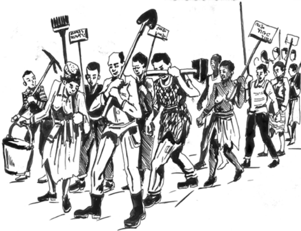
Fakkii 10.1. Misoomaasafisiisuuf waliin haa sochoonu.