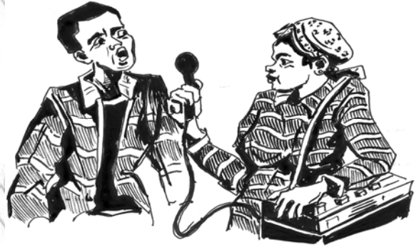
Fakkii 10.2 Gaaffii fi deebii Obbo Qoric-hoo Amaan waliin taasifame