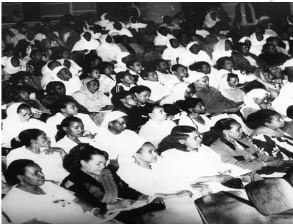
Fakkii 10.5 Walgahii waldaa dubartootaa