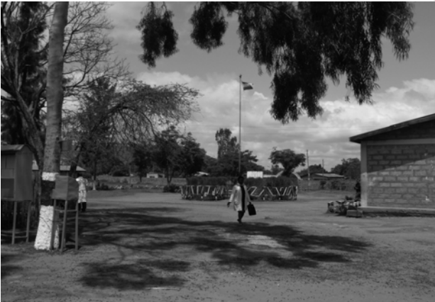
Fakkii 10.4. Hojimaati manneen barnootaa iftoomaa fi ittigaafatamummaa kan qabu ta'uu qaba.

Fakkeenyaaf barattoota lammii gaarii kan taasisu barumsa qabatamaa kennuu fi firii isaanii madaallii walitti fufaan mirkaneessuun tajaajila guddaa akka tahe keenyeerra. Barattoota keenyaaf tajaajila gorsaa gaarii fi faayidaa qabeessa ta'e kennuuf waliigalleerra. Barattoonni keenya kutaatii alatti barumsa qabatamaatiin akka cimaniif carraa barumsa walm-addeessaa mijeesuun hirmaachisuuf karoorfanneerra. Maatii barattootaa yookin kan isaaniin guddisan haala qabiinsa barumsaa ijoollee isaanii beekuu waan fedhaniif deebii saffisaa fi barbaachisaa ta'e kennuuf karoorri qabameera.