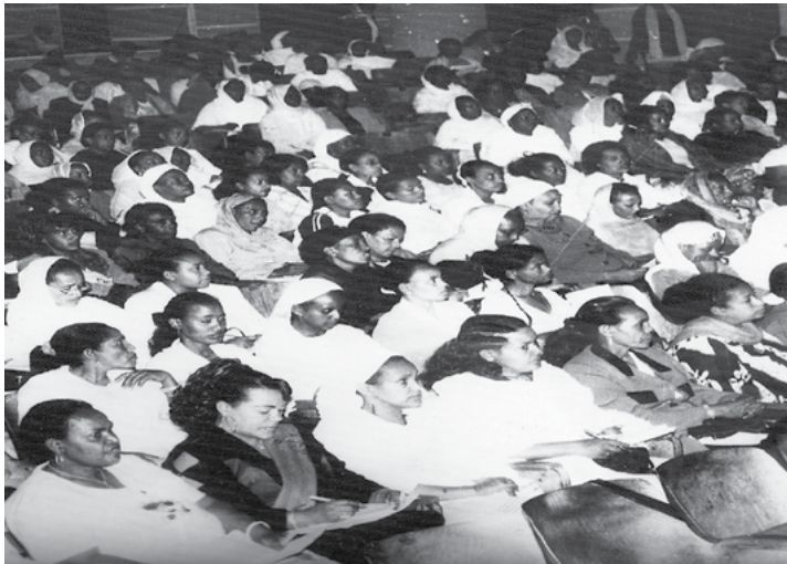
ስእሊ 10.5 ኣኼባ ደቂ ኣንስትዮ