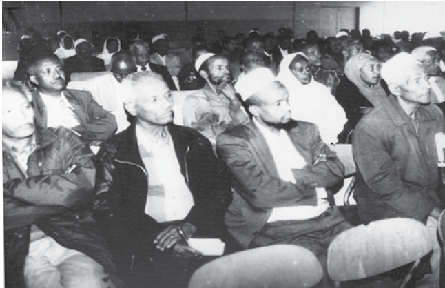
ሰእሊ. 10.6 ኣፈሻዊ ኣኼባ ፎረም ነበርቲ ኣዲስ ኣበባ

ኣብ ኣዲስ ኣበባ ከተማ ኣብ 1999 ዓ.ም ዝተፈላለዩ ክፋል ሕብረተሰብ ኣብ ኣወዳድባ ብነበርቲ ቀበሌ ሓበራዊ ፎረም ተጣይኹ እዩ። እቶም ቀንዲ መስረቲ ፎረም ማሕበራት ደቂ ተባዕትዮን ደቂ ኣንስትዮን እዮም። ብድሕሪኡ ብከተማ ለኽ(ደረጃ) ናብ ፎረም ነበርቲ ተጠቓሊሉ እዩ።