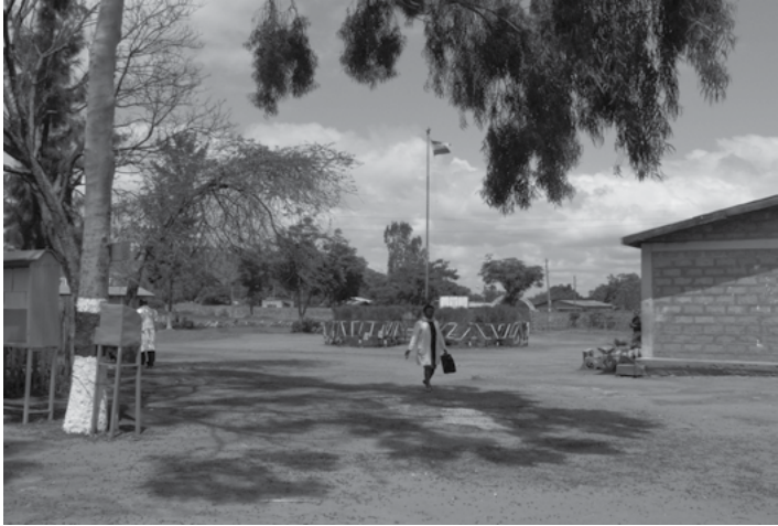
ስእሊ.10.4 ኣመራርሓ ቤት ትምህርቲ ተሓታትነትን ግልፅነትን ዘለዎ ክኾን ይግባእ

ንተምሃሮና ቅነዕን ጠቓምን ግልጋሎት ምኽሪ ምሃብ እቲ ካሊእ ተግባር ከም ዝኾነ ፈሊና ኢና። መረዳእታ ትምህርቲ ብእዋኑ ክንህበም ከምዝግባእ ተስማሚዕና ኢና። ተምሃሮ ካብ ክፍሊ ወፃኢ ብተግባራዊ ትምህርቲ ክህነፁ ግዳማዊ ንጥፈት ኩነታት ኣመቻቺና ክነሳትፎም ተሊምና ኢና። ወለድን መዕበይትን ብዛዕባ ተምሃሮ ደቆም ኣተሓሕዞ ትምህርቲ ንምፍላጥ ስለዝደልዩ ስለጥን ግቡእን ምላሽ ንምሃብ ትልሚ ተታሒዙ እዩ።