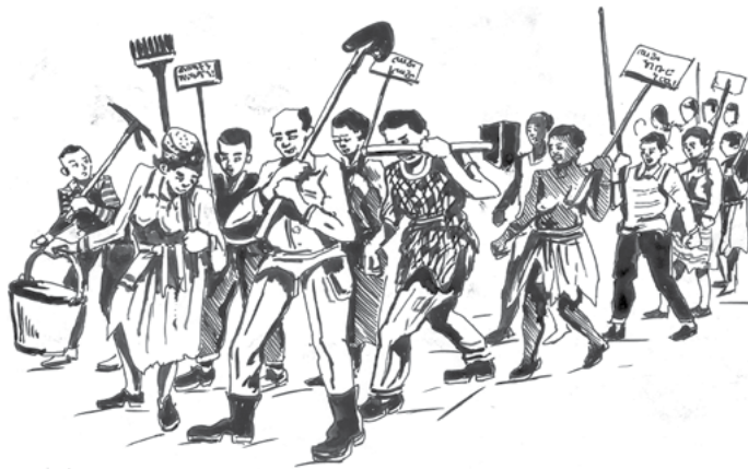
ስእሊ 10.1. ልምዓትና ንምቅልጣፍ ሓቢርና ንለዓል