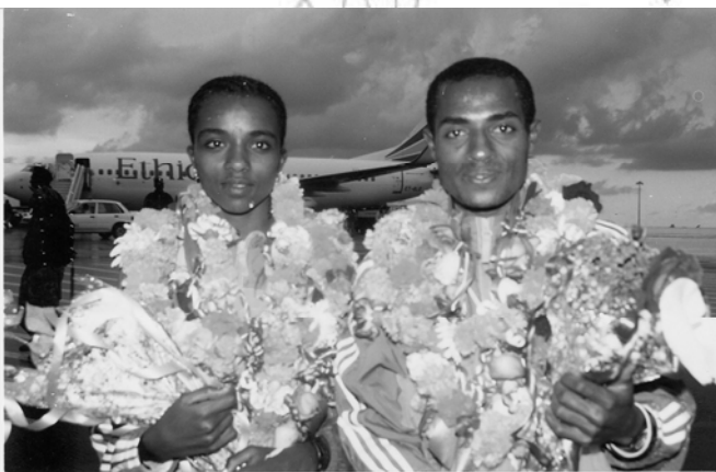
ሥዕል 11.2 አትሌት ጥሩነሽ ዲባባና ቀነነሳ በቀሰ

በሚቀጥለው ክፍለጊዜ ተማሪዎቹ እነዚህን ነጥቦች የሚያዳብሩ በቂ ሐሳቦችን በየቡድናቸው ይዘው ቀረቡ። ማዳበሪያ ነጥቦቹም ከተለያዩ ምንጮች መገኘታቸው በሚከተለው ሁኔታ ይታያል።