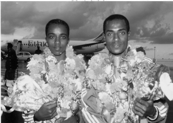
11.2 Xuruneesh Dibaabaa fi Qananiisaa Baqqalaa

Fakkiiwwan armaan olii ilaalchisee beekumsa keessan dagaagfachuu yoo barbaaddan karaa maal maaliin fayyadamuu akka dandeessan ibsaa.