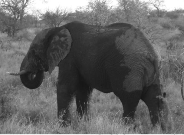
Fakkii 11.1 Arba Afirikaa