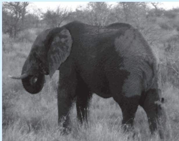
Jaantuska 11.1. Maroodiga Afrika