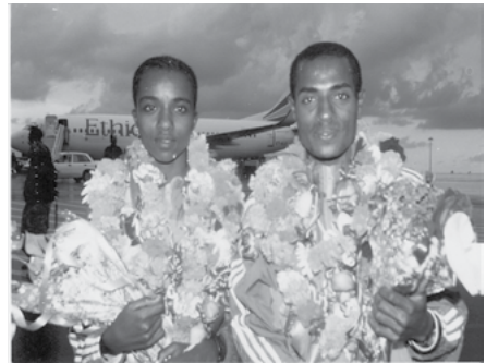
ስእሊ.11.3 ጥሩነሽ ዲባባን ቀነኒሳ በቀለን