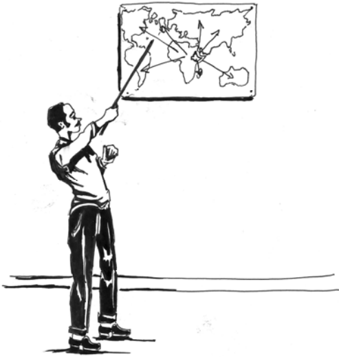
ሥዕል 1.5 ኢትዮጵያ ከተለያዩ የዓለም ሀገራት ጋር መልካም ግንኙነት አላት