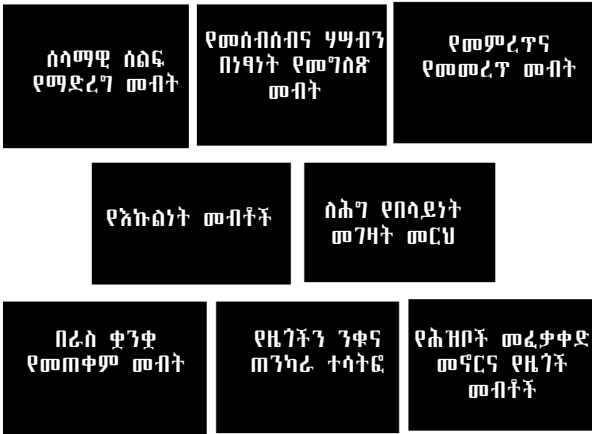
ምዕራ 1.2 የዲሞክራሲ ሥርዓት ግንባታ መሠረቶች