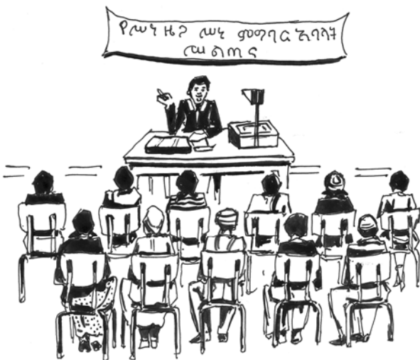
ሥዕል 1.1 የሠነድ ሠነድ ምግባር ክብብ አባላት በሥልጠናው ላይ በንቃት ሲሳተፉ