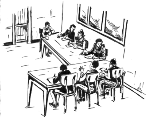
ምዕል 1.4 የጓደኛዎቹ ውይይት