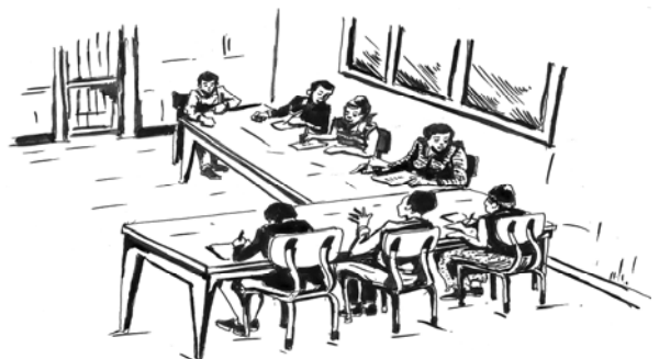
Fakkii 1.2 Marii hiriyoottaa