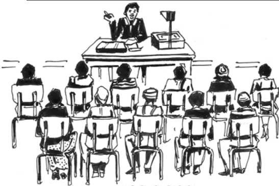
Fakkii 1.1 Miseensonni Gumii Barnoota Lammummaa fi Amala Gaarii leenjii irratti yeroo hirmaatan.

Fakkii armaan olii bu'uura godhachuudhaan maalummaa ijaarsa dimookiraasii ibsaa.