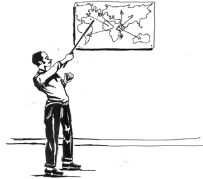
Fakkii 1.3 Itoophiyaan biyyoota addunyaa adda addaa waliin hariiroo gaarii qabdi.