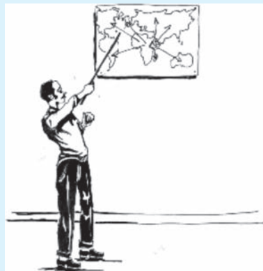
Jaantuska 1.5. Xidhiidhka Caalamiga ee Itoobiya