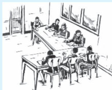
Jaantuska 1.4. Wada tashi Saaxiibtinimo