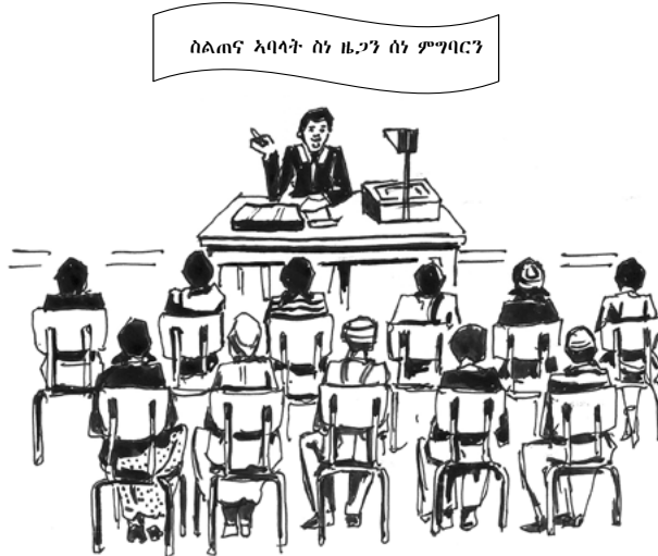
ስእሲ 1.1 ኣባላት ክለብ ስነ-ዜጋን ስነ-ምግባርን ቤት ትምህርቲ ኣብ ስልጠና ብኣቋቋሙ እንትሳተፉ