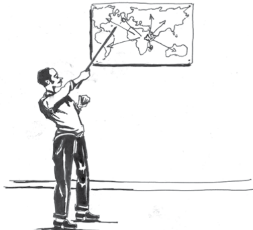
ስእሲ 1.5 ኢትዮጵያ ምስ ሃገራት ዓለም ዘለዋ ዕቡቕ ርክብ ዘርኢ ካርታ