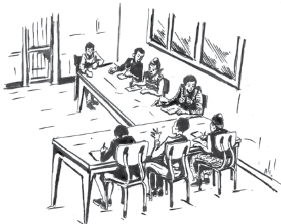
ሰእሊ 1.4 ምይይጥ መሓዙት