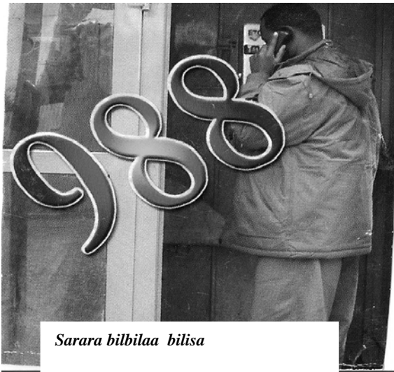
Sarara bilbilaa bilisa

Fakkii 2.4 Malaammaltummaa ittisuu ittigaafatamummaa lammailee hundaati. Madda KNFME (Komiishinii Naamusaa fi Farra Malaammaltummaa Federaalaa)