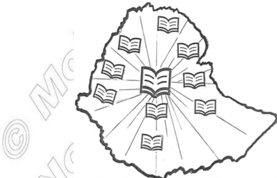
Fakkii 2.1 Heerawwan

Kanatti aanee heera MFDRI fi seensa heera Sabootaa, Sablamootaa fi Ummattoota Naannoo Kibbaa keessaa yaadawwan muraasni dhiyaataniiru. Gareen ta'uun yaadawwan dhiyaatan kannneen walbira qabuun gaaffilee dhiyaataniif deebii barreeffamaan dhiyeessaa.