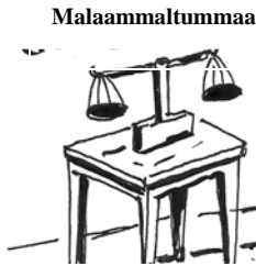
Fakkii 2.4 Malaammaltummaa ittisuun haqa haa mirkaneessinu.