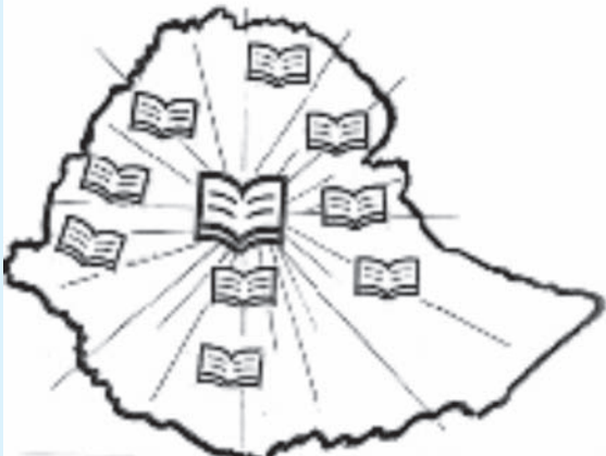
Jaantuska 2.1. Dastuurada