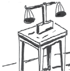
ስእሊ 2.3.2 ግዕዝይና ብምውጋድ ፍትሒ ነፅሰል