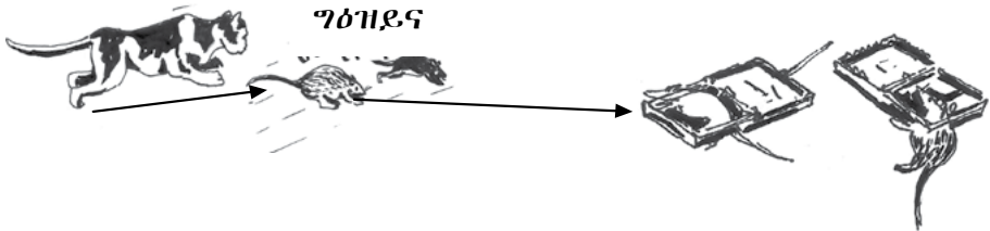
ስእሊ 2.3.1 ግዕዝይና ንክላኸል