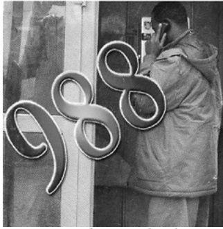
ነፃ መስመር ስልክ.