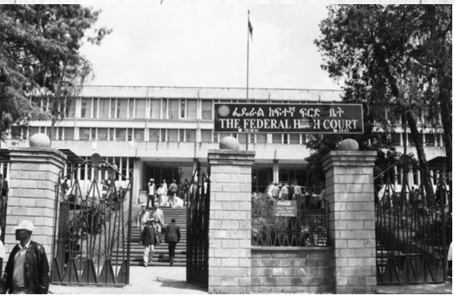
ሥዕል 4.1 ፍርድ ቤቶች ፍትሕን በማስፈን በኩስ ሰፊ ሚና ይጫወታሉ