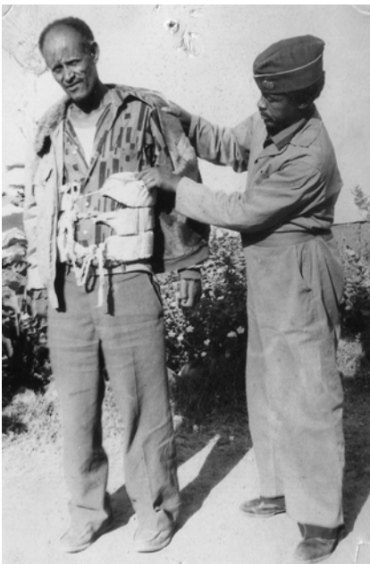
ምዕል 8.2 የኮንትሮባንድ ንግድ የሀገር እድገት ፀር ነው

የኮንትሮባንድ ንግድ በሀገር ኢኮኖሚ እና ማህበራዊ ህይወት ላይ የሚያደርሰው ጉዳት ምንድን ነው?