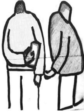
Fakkii 8.2 Daldalli kontiroobaandii farra guddina biyyaa ti.