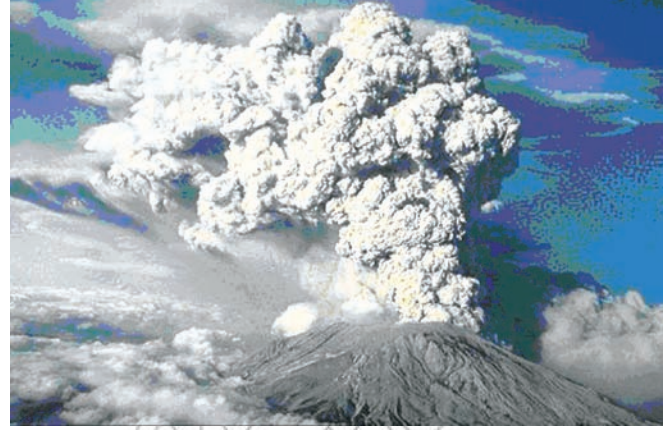
(b) Aara Volkaanoo