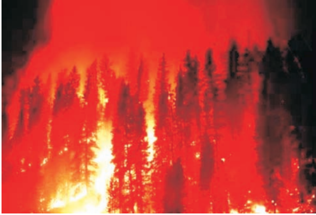
(a) Aara Ibdda bosonaa