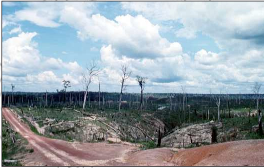
ሰእሊ 3.2፡ ብርሰት ኣግራብ