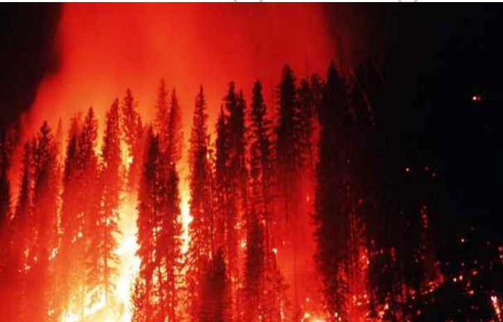
ሰእሊ. 3.8: ሳዕቤን ባርዕ ሓዊ

ተምሃሮ ካብቶም ዝተዘርዘሩ ቐንዲ ሳዕቤናት ምውዓይ ዓለም ኣብ ልዕሊ ጥዕናን ህይወትን ደቂ ሰባት፣ ኣብ ልዕሊ ምህርቲ ሕርሻ፣ ኣብ ልዕሊ ሃፍቲ ማይ፣ ኣብ ልዕሊ እንስሳትን ደቂ ሰባትን ዝመሳሰሉን ዝበፀሑ ሓደጋታት እቶም ጎሊሆም ዝረኣዩ እዮም። ብምክንያት ምውዓይ ዓለም ነባሪ ኣዩር በብእዎኑ እናተሰዋወጠ እዩ። ኣብ ሳዕሊ ከምዝተገለፀ ኣብ ፓኪስታን ሓደጋ ውሕጅ ኣብ ዝተኸሰተሉ ተመሳሳሊ እዋን መወዳእታ ወርሒ ሓምሌ 2002 ዓ/ም ኣብ ፍስፍና እንታይ ክስተት ከም ዝተፈጠረ ትዝክሩዩ? ኣብ ፓኪስታን ንሰሜን ኣንፈት ኣብ እትርከብ ፍስፍና መጠን ረስኒ ናብ ልዕሊ 40° ሴ በዊሒ ኔሩ። ካብዙይ ልዑል መጠን ረስኒ ድማ ባርዕ ሓዊ ተላዒሉ። ኣብ ልዕሊ 350 ዝተፈላለዩ ቦታታት ዱር ብዝተለዓለ ባርዕ ሓዊ ብኣሸሓት ዝቁፀሩ ኣግራባት በሪሶም። ንከተማ ሞስኮ ሓዊሉ ብዙሓት ቦታታት ኣዩሮም ተበኪሉ። ሰባትን እንስሳትን ሞይቶም። ብዙሕ ዕንወት በዊሒ።