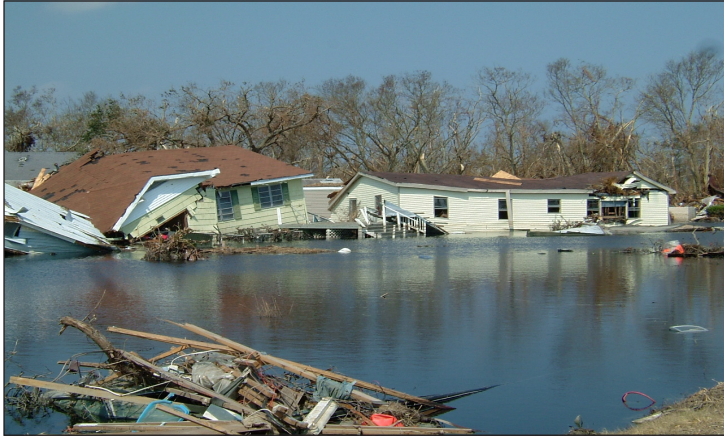
ሰእሊ. 3.7: ሳዕቤን ውሕጅ