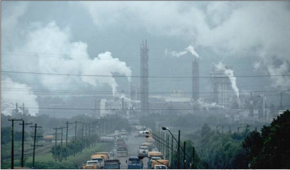
ሰእሊ. 3.3፡ ብኸለት አየር