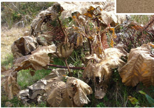
ስእሊ 3.6: ሳዕቤን ዝናብ ኣሲድ