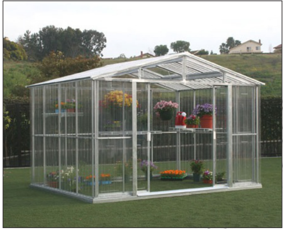
ስእሊ 3.4: ፈልስታት አብ ግሪን ሃውስ