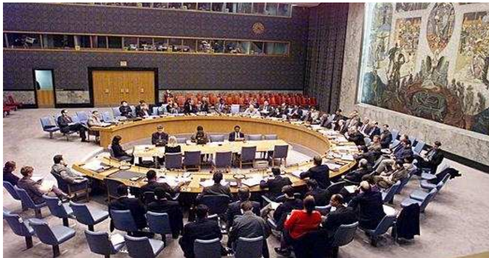
ምስል 4.6 በተባበሩት መንግሥታት የጸጥታው ምክር ቤት ስብሰባ