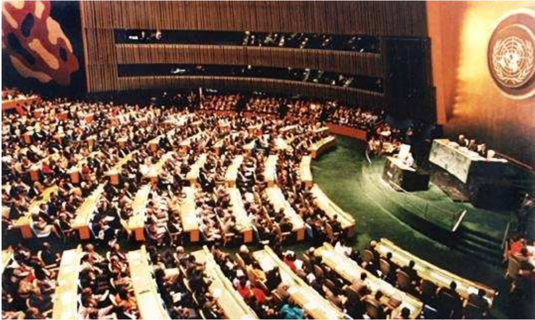
ምስል 4.5 የተባበሩት መንግሥታት ጠቅላላ ጉባኤ