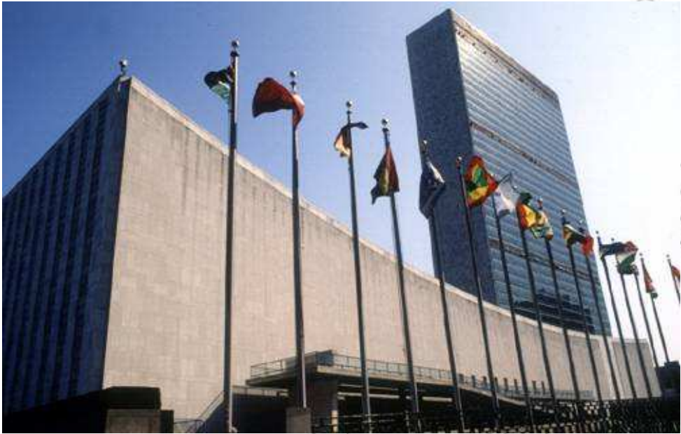
ምሥል 4.4 የተባበሩት መንግሥታት ድርጅት ዋና ጽሕፈት ቤት በኒውዮርክ

የተባበሩት መንግሥታት ድርጅት ዋና ጽሕፈት ቤት የሚገኘው በሰሜን አሜሪካ ኒው ዮርክ ከተማ ነው። የድርጅቱን ውሳኔዎች ለመቀበል ፈቃደኛ የሆነና በቻርተሩ ላይ የሠፈሩትን ግዴታዎች ተቀብሎ ተግባራዊ ለማድረግ የተስማማ ማንኛውም ሰላም ወዳድ ሀገር የድርጅቱ አባል ሊሆን ይችላል።