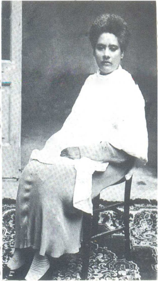
ምስል 4.2 ወይዘሮ ሸዋረገድ ገድሌ

ወይዘሮ ሸዋረገድ ገድሌ በአማራ ብሔራዊ ክልል በሚገኘው በሰሜን ሸዋ ዞን በደብረ ብርሃን ከተማ እ.ኤ.አ በ1878 ዓ.ም. ተወለዱ። እ.ኤ.አ በ1928 ዓ.ም ፋሺስት ኢጣሊያ ኢትዮጵያን በወረረበት ጊዜ ከወንድ አርበኞች ጉን በመሰለፍ ታላቅ የጀግንነት ሥራ አከናውነዋል። በወቅቱ የኢትዮጵያ ሰንደቅ ዓላማ ወርዶ የኢጣሊያን ባንዲራ ሲወለበለብ አይተው በማልቀሳቸው ታስረው ብዙ ግፍ ደርሶባቸዋል። ከተለቀቁም በኋላ እ.ኤ.አ በ1932 ዓ.ም በአዲስ ዓለም ከተማ የፋሺስት ምሽግ እንዲሰበር ከፍተኛ አስተዋጽኦ አድርገዋል።