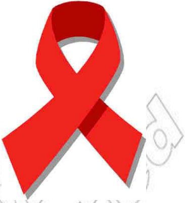
ምስል 4.1 ቀዩ ሪቫን

በዓለም ከሚገኘው ሕዝብ ግማሽ የሚሆነው ዕድሜው ከ25 ዓመት በታች ነው። በኤች.አይ.ቪ ከተያዙ ከ10 ሚሊዮን በላይ የሚደርሱ ወጣቶች ዕድሜያቸው ከ15 እስከ 24 ዓመት ነው። በአፍሪካ ደግሞ ዕድሜያቸው ከ15-24 ዓመት የሚደርስ አራት ሚሊዮን ወጣት ሴቶች በቫይረሱ ተይዘዋል። በኢትዮጵያም በኤች.አይ.ቪ ከተያዙት የኅብረተሰብ ክፍሎች አብዛኛዎቹ ዕድሜያቸው ከ15 እስከ 24 ዓመት የሆኑ ወጣቶች ናቸው። በተለይም የወጣት ሴቶች ያለ ዕድሜ ጋብቻ፣ ጠለፋ፣ የሴት ልጅ ግርዛትና አስገዳዶ መድፈር ሴቶች ለቫይረሱ ያላቸውን ተጋላጭነት ከፍተኛ ያደርገዋል።