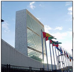
ስእሊ. 4.5፡ ቤት ዕሕፊት ው.ሕ.መ.ዓለም

ሓፊሻዊ ጉባኤ፡ እዚ ኩለን ኣባል ሃገራት ተ ራኪቦን ዓበይቲ ውሳኔታት ዝህባሉ/ ዘሕልፋሉ ላዕላይ ኣመራርሓ እዩ። ነዚ ንምክያድ ስሩዕ እዋን ዝንፀረሉን ነዚ ዝመርሕ ካብቶም ኣባላት ዝምረፅ ፕረዚዳንት ብምክያድ ይኸውን። ኣብዚ እዋን ኩለን ኣባላት ሓፂር ፀብዓብ ንክቕርባ ይግበር እዩ። ኣብዚ ጉባኤ ኩለን ሃገራት ማዕረ ድምዒ ኣለዉን። ኣብዚ ዝውሰን ውሳኔ ናይቲ ውድብ ሓፊሻዊ ጉባኤ፤ እዚ ኩለን ኣባል ሃገራት ተራኪቦን ውሳኔ ዝህበሉ ላዕላይ ኣመራርሓ እዩ። ነዚ ንምክያድ ስሩዕ እዋን ዝንፀረሉን ነዚ ዝመርሕ ካብቶም ኣባላት ዝምረፅ ፕረዚዳንት ብምክያድ ይኸውን። ኣብዚ እዋን ኩለን ኣባላት ሓፂር ፀብዓብ ንክቕርባ ይግበር እዩ። ኣብዚ ጉባኤ ኩለን ሃገራት ማዕረ ድምዒ ኣለዉን። ኣብዚ ዝውሰን ውሳኔ ናይቲ ውድብ።