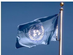
ስእሊ. 4.4፡ ሰንደቅ ዓላማ ው.ሕ.መ.ዓለም

ሰንደቅ ዓላማ፡ አርማን ቤት ዕሕፊትን ውድብ ሕቡራት መንግስታት ዓለም፤ መሓውርን ቀንዲ ትካላትን ውድብ ሕቡራት መንግስታት ዓለም ብዝምልከት ሓሙሽተ ወሰንቲ ዝኾኑ መሰረታዊ ውዳበታት መሓውርን ትካላትን ሕቡራት መንግስታት ዓለም ኣለዉ። እዚኦም ድማ ዝስዕቡዮም፤ ሓፊሻዊ ጉባኤ፤ ቤት ምክሪ ፀጥታ፤ ቤት ዕሕፊት፤ ዓለምለኽ ቤት ፍርዲ ፍትሒ፤ ከምኡውን ቤት ምክሪ ኢኮኖሚን ማሕበራውን ጉዳያት ዝበሃሉዮም።